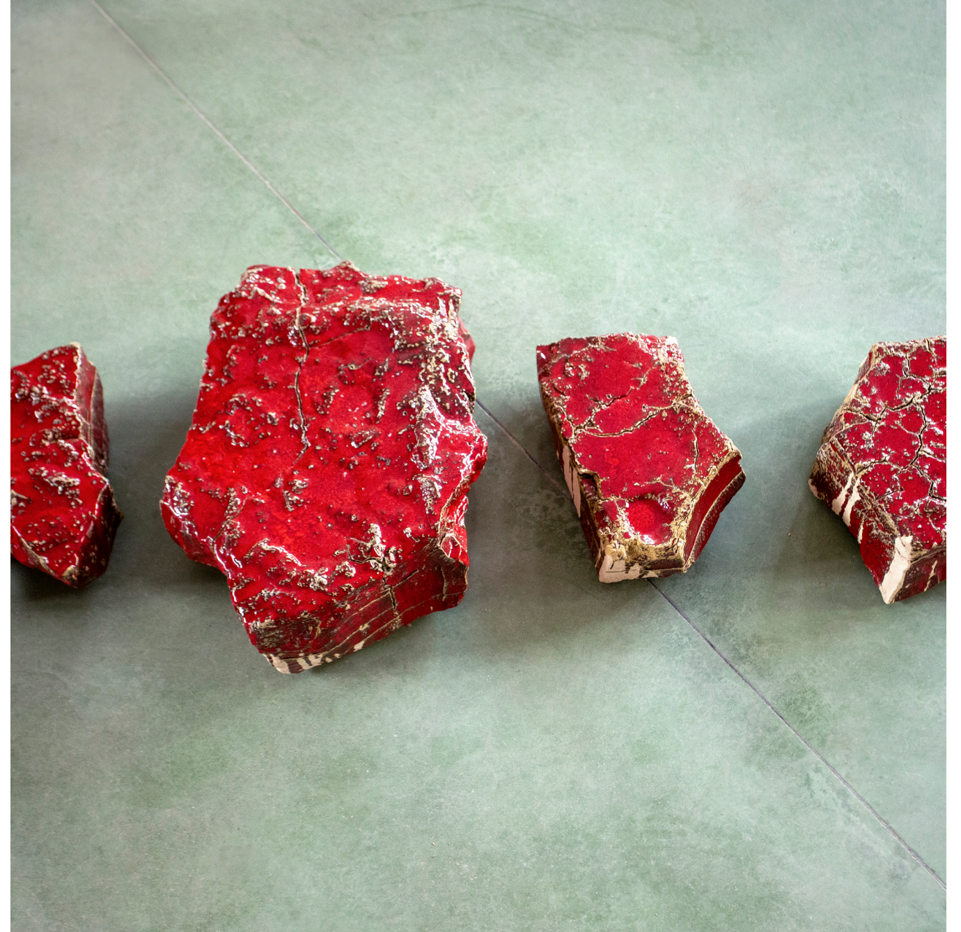
TERZO PAESAGGIO, zolle di alluvione, smalto al selenio, 2024