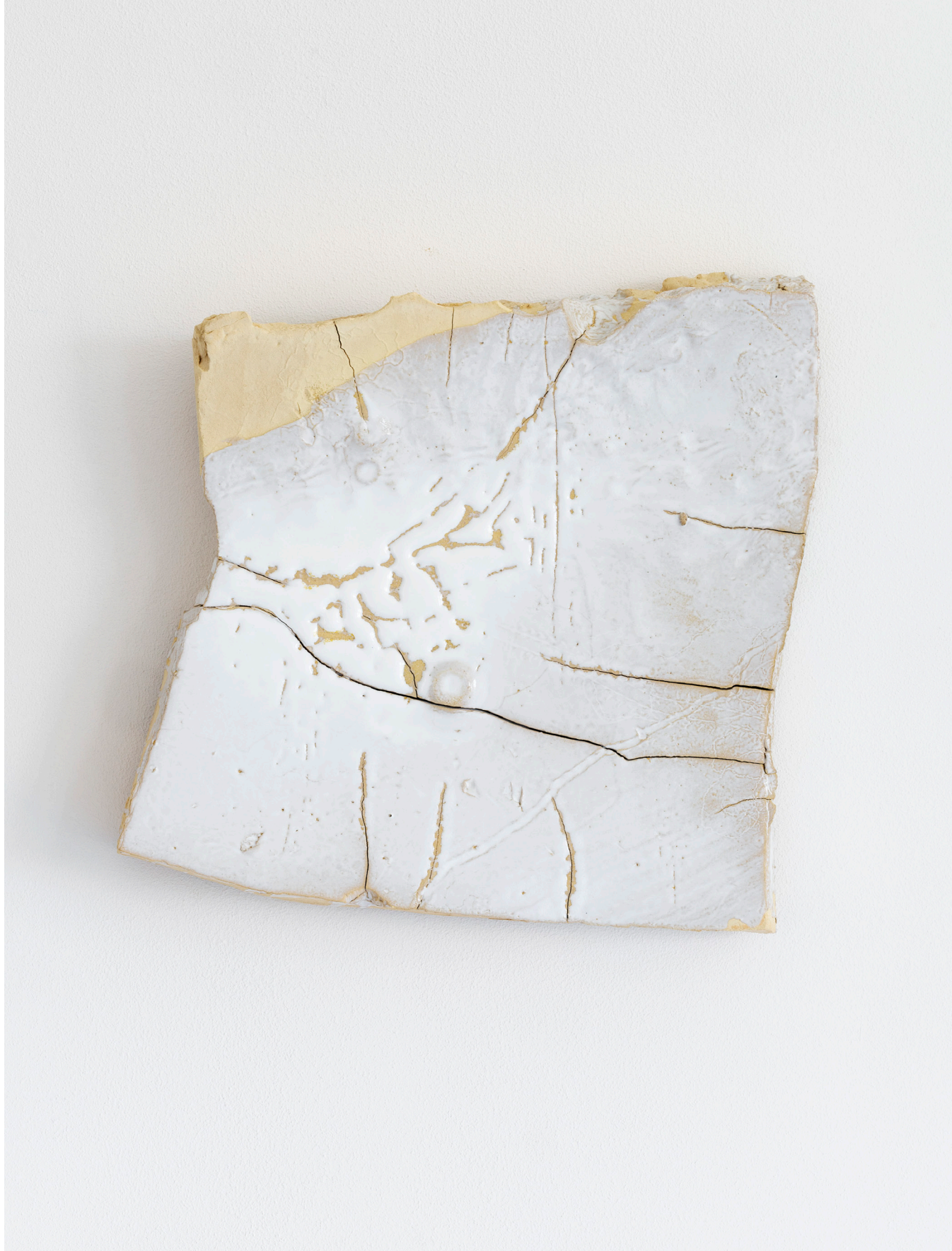
TERZO PAESAGGIO ( i Bianchi di Faenza ), zolla di alluvione e smalto, 2025

I DINOSAURI (dalla serie Fiori), matita colorata su carta, 2025